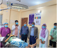
বিনামূল্যে মেডিকেল ক্যাম্প অনুষ্ঠিত