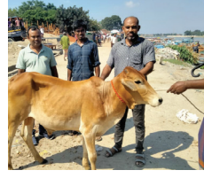
আয়বর্ধনমূলক কর্মকাণ্ডের আওতায় অনুদান ও উপকরণ বিতরণ